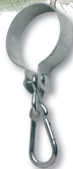
Gyngebeslag med karabinhage til fastgørelse på stolper. Findes til 80mm og 100mm stolper