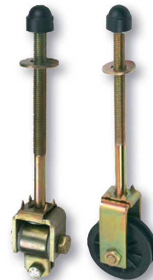
Gyngeruller til kæde og tov. Udformet så børnene ikke hænger fast i den hvis de klatrer i gyngestativet.