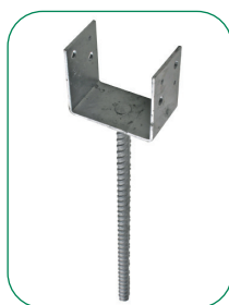
U-profil 101x400 Varmforzinket PN nr. 659200107