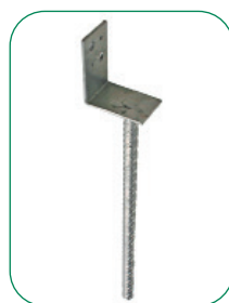
L-profil 75x400 Varmforzinket PN nr. 659600107