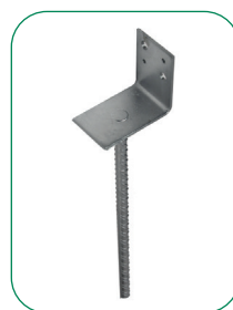
L-profil 101x400 Varmforzinket PN nr. 659700107