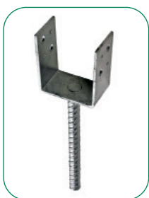
U-profil 75x200 Varmforzinket PN nr. 659000107