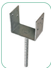
U-profil 101x200 Varmforzinket PN nr. 659100107